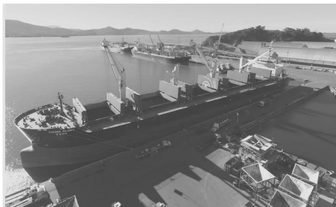
PORTO DE SÃO FRANCISCO DO SUL FECHA O ANO DE 2017 COM MOVIMENTAÇÃO POSITIVA

12) Notícia veiculada sobre Porto de São Francisco do Sul informa crescimento nas movimentações: